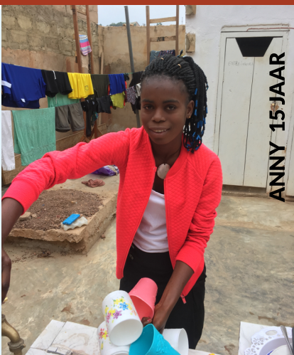
ANNY 15 JAAR

Misschien bent u het al van ons gewend: ook de komende maanden heeft stichting l'Amour du Prochain weer een leuke wijnactie. Door het bestellen van een goede kwaliteitswijn van wijnkoperij Henri Bloem uit Zwolle steunt u ons nieuwe project: een speelplaats voor de wijk waarin ons opvanghuis staat. Hiermee willen we iets betekenen voor de kinderen om het huis heen. Op de laatste pagina van deze brief vindt u meer over dit project.